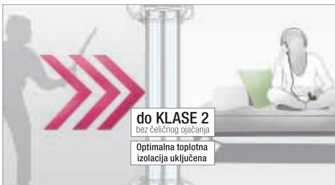
Protivprovalna zaštita: Osećajte se sigurno u svakom trenutku.